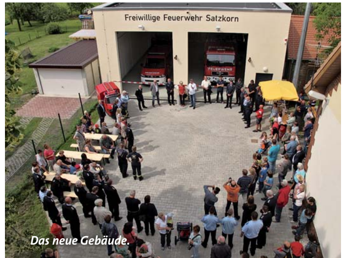
Das neue Gebäude.

Des Weiteren wurde der Freiwilligen Feuerwehr Satzkorn ein eigenes Mannschaftstransportfahrzeug MTF übergeben, welches durch den Fachbereich Feuerwehr in Zusammenarbeit mit dem Kommunalen Fuhrparkmanagement (KFP) beschafft wurde. Hier liegen die Kosten bei ca. 58.000 Euro. Dieses wird dann ebenfalls hier untergestellt. Das Fahrzeug dient vorrangig der Nachführung von Kameraden zu Einsatzstellen, aber auch für Fahrten zu Schulungen bzw. Ausbildungsabschnitten bei anderen Freiwilligen Feuerwehren der Landeshauptstadt bzw. zur Berufsfeuer-