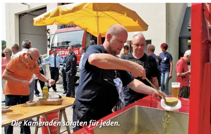
Die Kameraden sorgen für jeden.