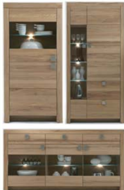
In Wildeiche und Kernbuche lieferbar