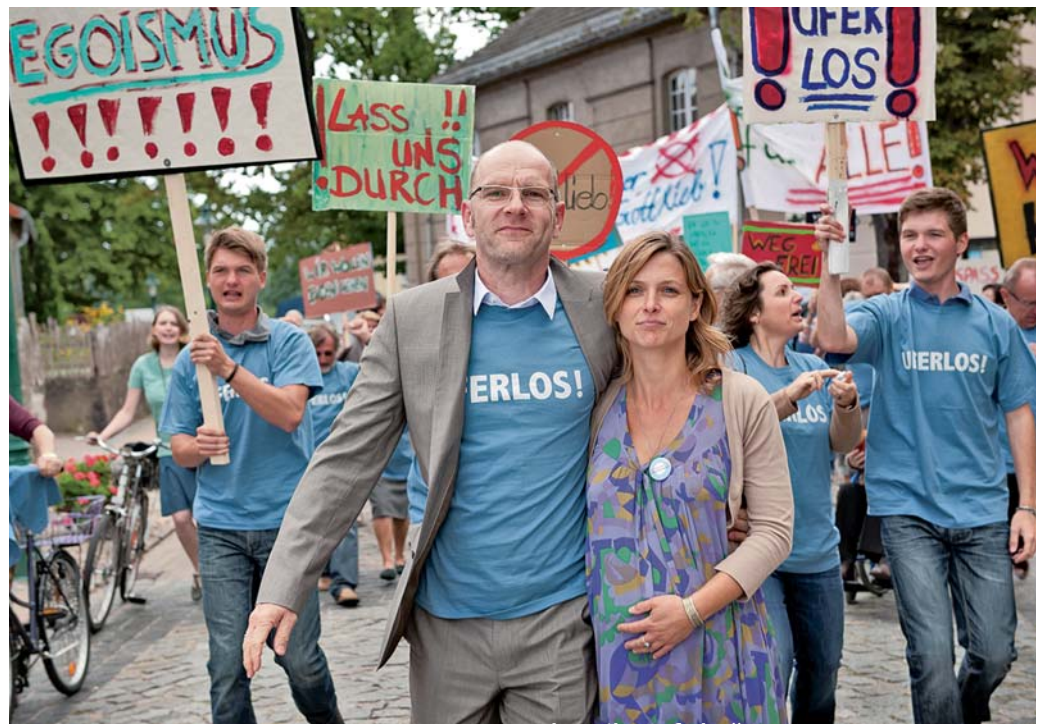
Szenen aus dem Film „Uferlos“.

Diese politisch-ökologische Auseinandersetzung bildet aber nur den Hintergrund für eine andere Geschichte, die ihren Lauf nimmt, als der lebenslustige Schwede Mikkel Nordergren ausgerechnet das Haus neben Marlies' Grundstück erbt. Da treffen Welten aufeinander: auf der einen Seite die rechthaberische, verbitterte Deutsche, die sich als Naturschützerin aufspielt, auf der anderen der liberale, weltoffene Schwede, der für einen Seezugang