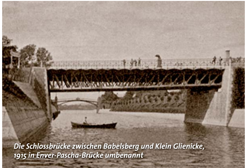
Die Schlossbrücke zwischen Babelsberg und Klein Gliencke, 1915 in Enver-Pascha-Brücke umbenannt

Ismail Enver, Militärattaché, seit 1913 als Generalmajor mit dem Ehrentitel „Pascha“ versehen, seit 1914 Kriegsminister strebte, ermutigt durch die deutschen Initiativen im Orient die Errichtung eines „Groß-türkischen Reiches“, in das Aserbaidschan, Turkestan und sogar Teile von China einbezogen werden sollten, an. Die deutschen wirtschaftlichen Interessen im Orient gerieten im Weltkrieg an der Frontlinie der osmanisch-bulgarischen Bündnispartner zum Ententegegner Großbritannien in Gefahr. Abhilfe sollte im Beduinengewand der ehemalige deutsche Hobbyarchäologe und nun geheime Diplomat Max von Oppenheim schaffen. Der Orientexperte durchreiste Arabien in