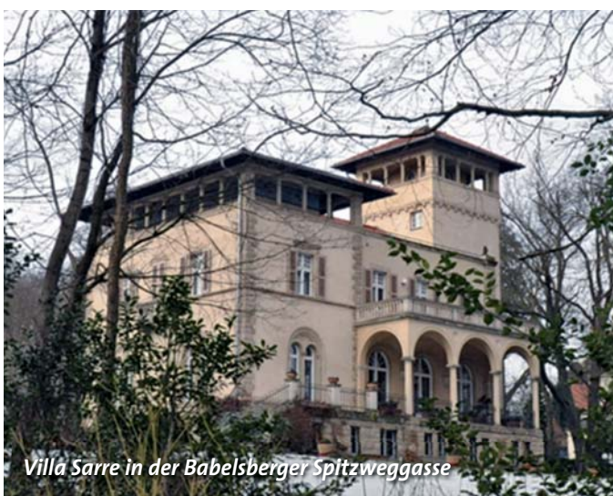
Villa Sarre in der Babelsberger Spitzweggasse