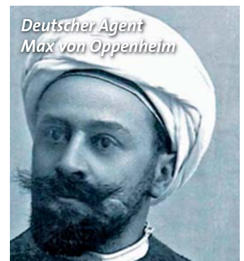
Deutscher Agent Max von Oppenheim