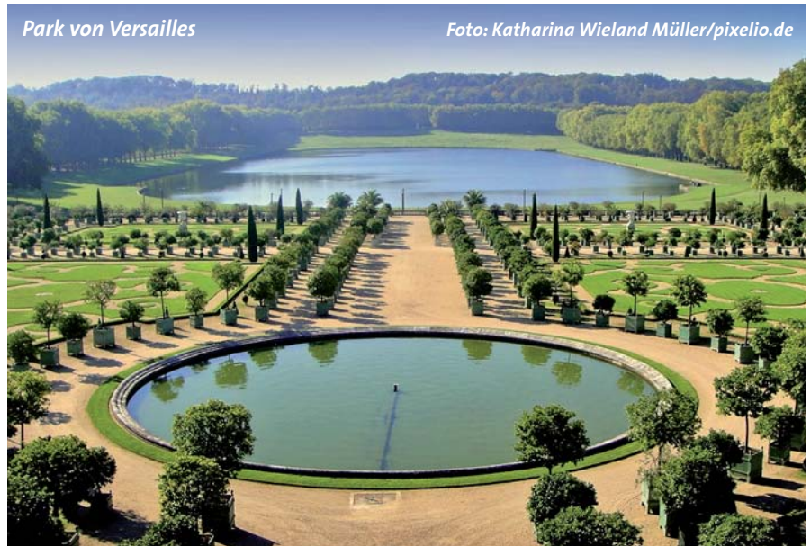
Park von Versailles

Interessenten werden gebeten, bis spätestens 31. Juli 2014 ihr Interesse an einer Teilnahme verbindlich zu bekunden, schriftlich unter Freundeskreis Potsdam-Versailles e.V. / Schulstraße 5 / D-14482 Potsdam, per Email unter info@pots-