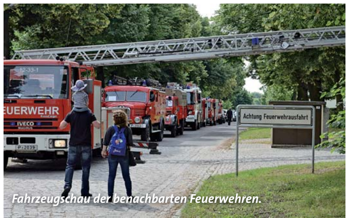
Fahrzeugschau der benachbarten Feuerwehren.