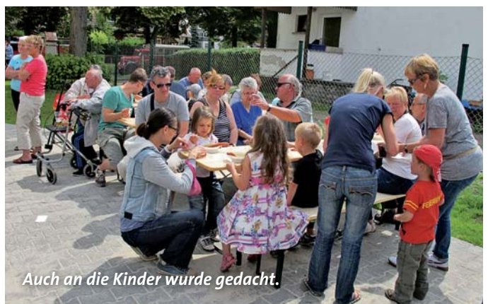
Auch an die Kinder wurde gedacht.