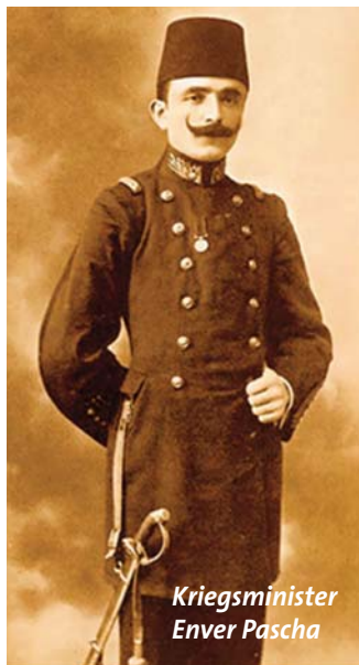
Kriegsminister Enver Pascha